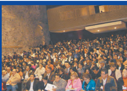
Séptima jornada de actualización jurídica