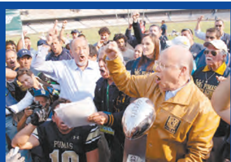
Pumas CU, Campeones de la Liga Mayor de la ONEFA