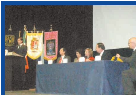
Exalumnos León-ExUNAM, presenta proyecto en Guanajuato

nador de Hidalgo, un pergamino que resalta a la UNAM como "forjadora de hombres útiles a la sociedad, comprometida siempre con el conocimiento, la ciencia y la cultura del país".