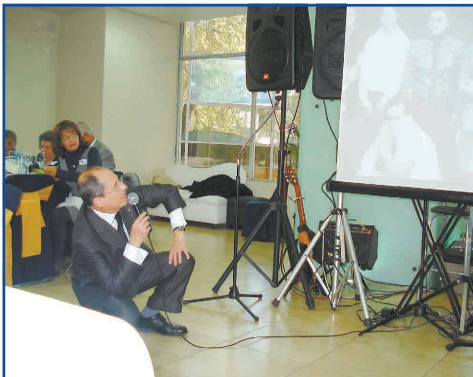
Comida para celebrar 50 años del ingreso a la Facultad de Contaduría y Administración

La reunión dio también a todos los presentes la oportunidad de manifestar el orgullo y la especial distinción de haber cursado la carrera en la UNAM, la cual habrán de portar toda la vida, y saberse por siempre, orgullosamente universitarios.