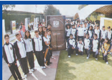
Una cápsula del tiempo, apuesta al futuro