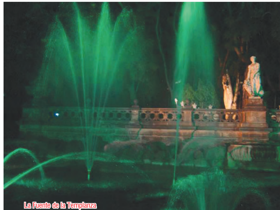
La Fuente de la Templanza