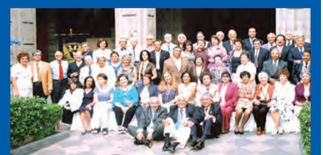
El grupo de preparatorianos 1920-1924 A.C., celebra su tradicional comida de la amistad PAG. 2