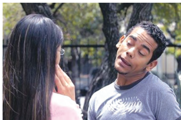
Son movimientos estereotipados, súbitos o repentinos

Los varones lo padecen más, en una proporción de cuatro a uno respecto de las mujeres