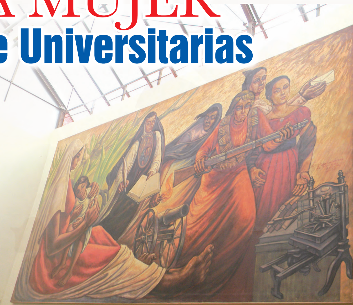
Una de las obras y piezas más representativas del museo, es el mural que se localiza subiendo las escaleras a la parte alta del recinto cultural

El Rector Narro concluyó que México requiere de la diversidad de voces para dar cabida a todos los sectores de la sociedad, y en ese sentido el museo refleja la acción de las mujeres mexicanas; de ahí la importancia de contar con él en nuestra ciudad.