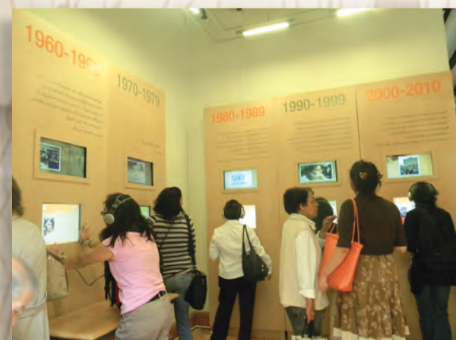
Cuenta con un área de audiovisuales en la que se explica el reconocimiento y valores de las mujeres en los últimos años