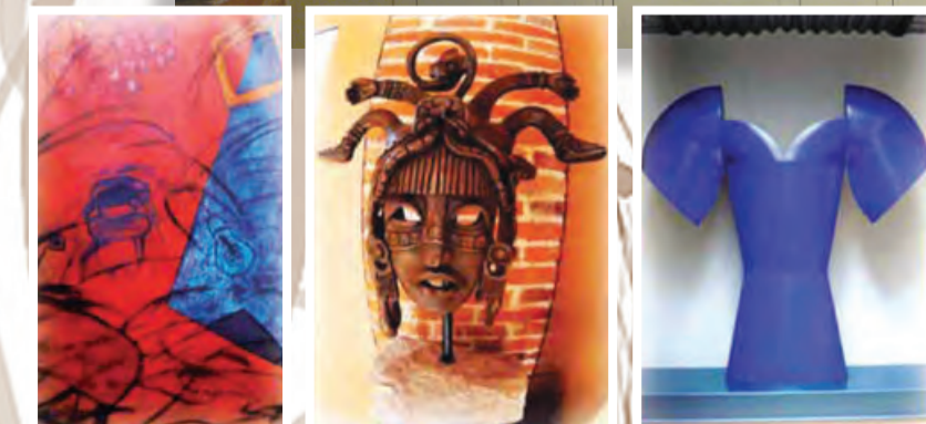
El recorrido es una historia cronológica a partir de los tiempos prehispánicos