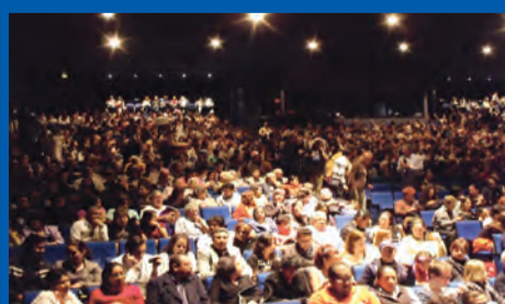
Un gran encuentro de Exalumnos en torno a una obra musical PAG. 11