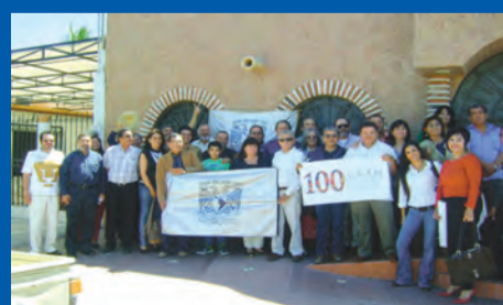
Reunión de Exalumnos de la UNAM en el estado de Baja California Sur PAG. 6