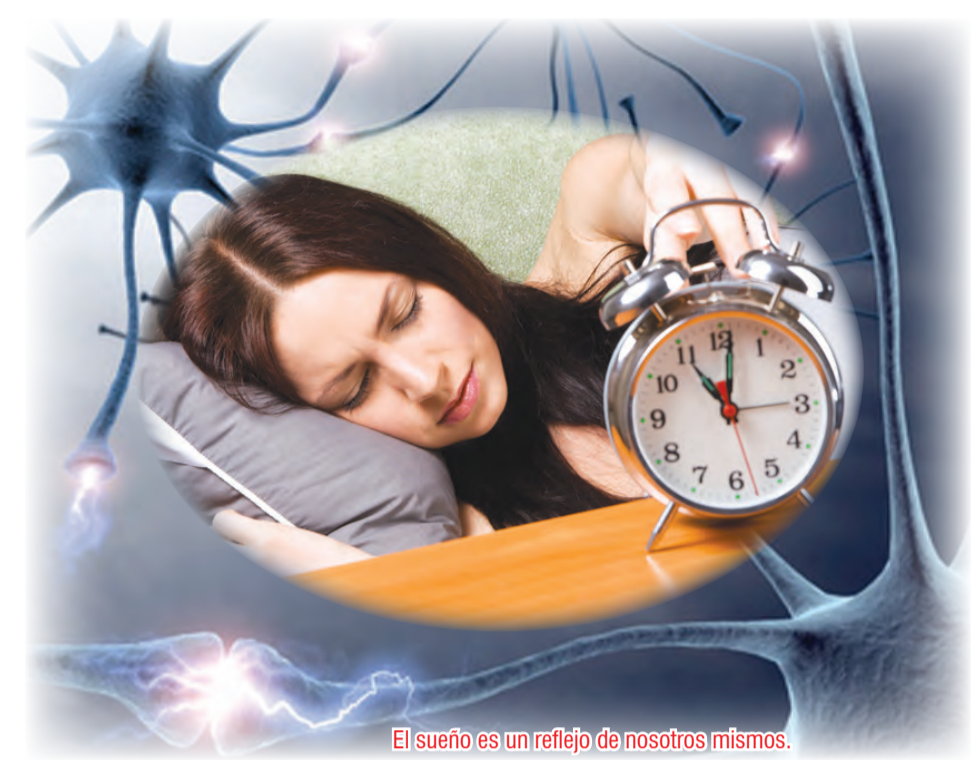
El sueño es un reflejo de nosotros mismos.

Uno de los primeros tratamientos utilizados fue la desensibilización sistemática, que incluye la exposición, una técnica que acerca a la persona al evento mediante una asociación establecida con un estímulo relajante. "Se hace un contracondicionamiento y la exposición funciona para diluir o extinguir el choque emocional", explicó González Cossío.