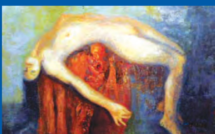
El museo de la mujer y La Federación Mexicana de Universitarias PAG. 8-9