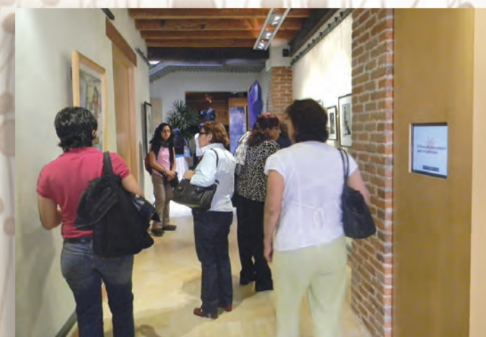
Las mujeres asistentes aprovecharon la inauguración del museo para recorrer los pasillos y tomar algunas apuntes