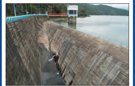
El Programa de Manejo, Uso y Reuso del Agua, PUMAGUA