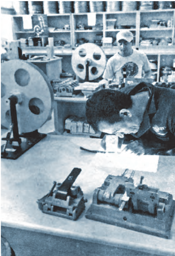
Rescate del acervo cinematográfico.

Con una superficie construida de dos mil 522 metros cuadrados y 360 de áreas exteriores, las nuevas instalaciones se integran por bóvedas de mayor capacidad, tienda, videoclub y biblioteca, entre otros espacios. Esta última tiene uno de los acervos bibliográficos y hemerográficos sobre cine más importantes en Latinoamérica, con un registro superior a 15 mil libros. Resguarda joyas