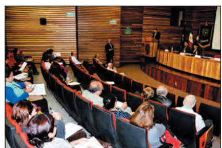
Quinta Jornada Nacional y Segunda Internacional de Odontología