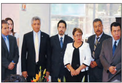
Cambio de Mesa Directiva de la ANEIA