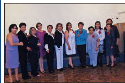
Nueva Mesa Directiva de la Asociación Mexicana de Odontólogos