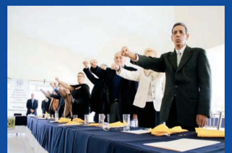
CAMBIO EN LA ASOCIACIÓN DE AGUASCALIENTES