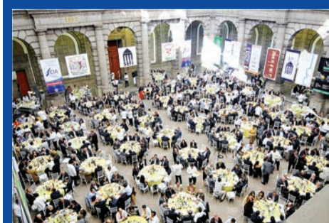
MEDIO SIGLO DE SEFI

La propuesta universitaria contiene 60 objetivos y casi 100 acciones enmarcadas en diez propuestas principales: Combatir el analfabetismo; Atender el rezago educativo; Garantizar el derecho y obligatoriedad de la educación; Recrear un proyecto educativo; Fundar un nuevo modelo escolar y de gestión educativa; Fortalecer la función social de la educación; Revalorar y renovar la profesión docente; Reorientar la evaluación educativa, la certificación y la acreditación; Asegurar el financiamiento que requiere la educación, la ciencia, la tecnología y la innovación; y hacer de México un país en formación permanente.