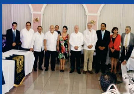
NUEVA MESA DIRECTIVA EN YUCATÁN