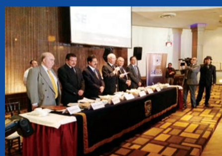
SEFCA RENUOVA SU PRESIDENCIA