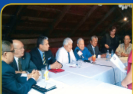
Nuevo Consejo Directivo de exalumnos en Michoacán