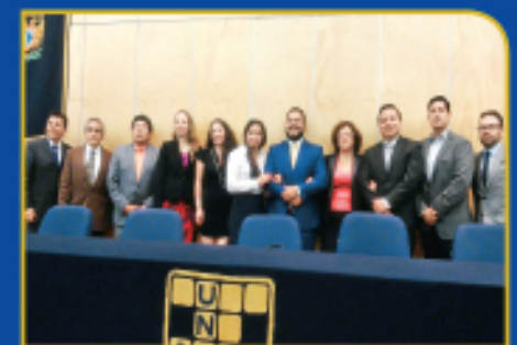
Se registra una nueva agrupación de exalumnos