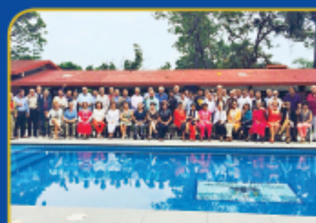
Aniversario de los exalumnos en Morelos