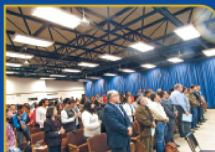
5º Congreso Nacional de Egresados de Veterinaria