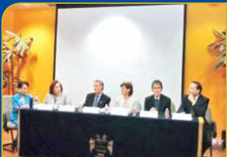
35 años de Asociación Mexicana de Odontólogos