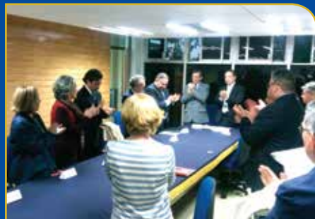
Nueva asociación de psicólogos