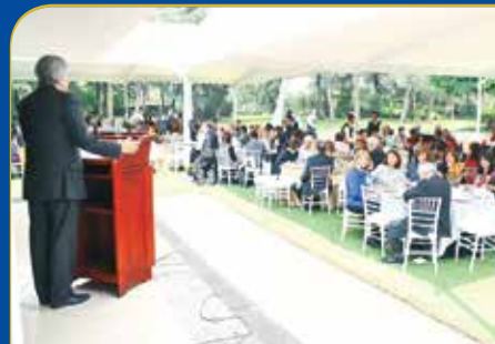
Tercera comida de Ciencias