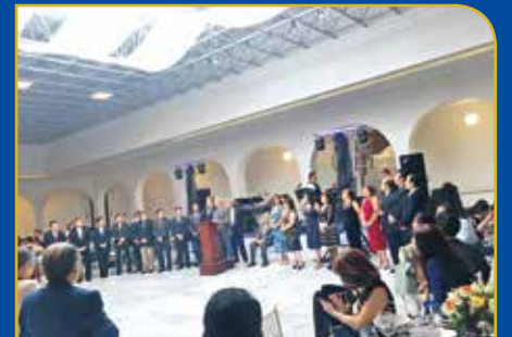
80 años Prepa 2 de Iniciación Universitaria