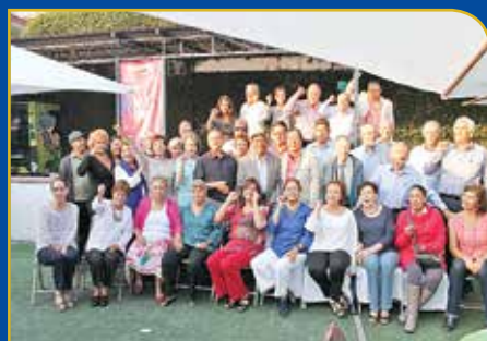
Reunión de egresados en Morelos