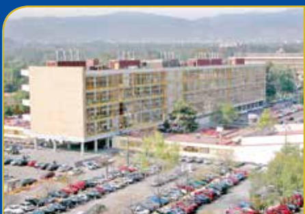
Desayuno en la Facultad de Química