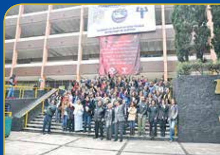
Reunión de Psicología