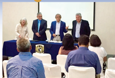
Reunión de Egresados en el estado de Querétaro