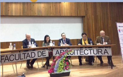
Reuniones Académicas sobre el color