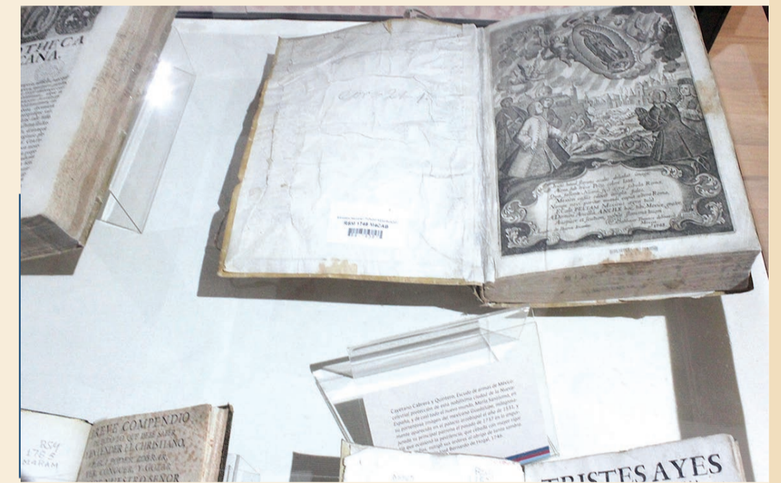
LA MUESTRA ESTÁ CONFORMADA POR CUATRO APARTADOS CRONOLÓGICOS (1. SIGLOS XVI Y XVII, 2. SIGLO XVIII, 3. SIGLO XIX Y 4. SIGLOS XX Y XXI)