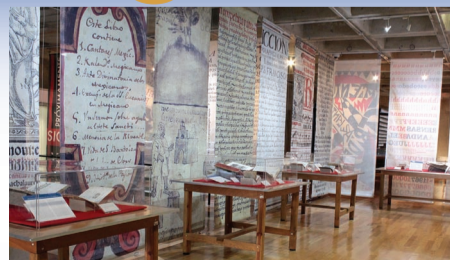
La Biblioteca Nacional cumple 150 años