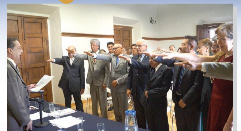
Cambio Mesa Directiva en Michoacán