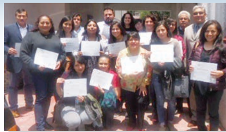
Curso-Taller de agrupación de sociólogos egresados de FES Acatlán