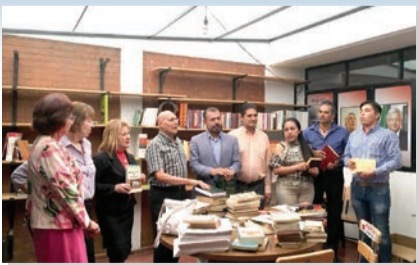
Exalumnos UNAM en el Estado de Michoacán