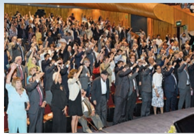
Día Del Maestro y Autonomía Universitaria