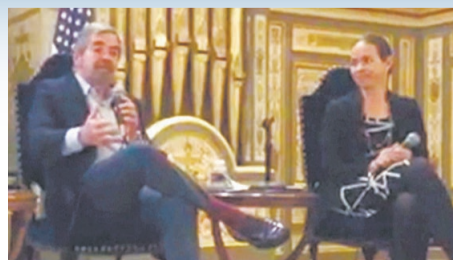
Conferencia de Red UNAM DC en Washington