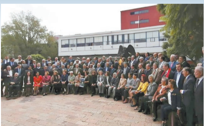
50 Años de la Generación 69-73 de Abogados