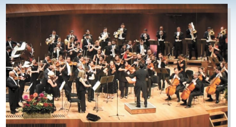
Concierto Beatles en la Sala Nezahualcóyotl