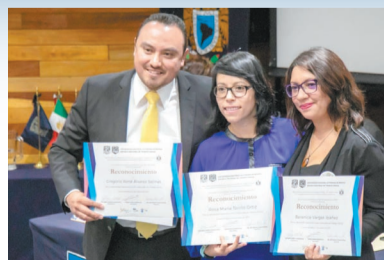
Egresados premiados en Trabajo Social