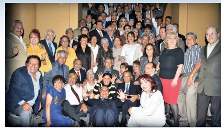
Prepa 2 celebra medio siglo de la Generación 64-69 con un libro