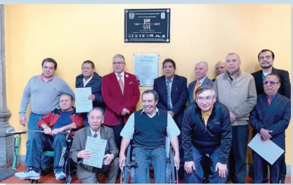
Placa conmemorativa del 68 en San Ildefonso