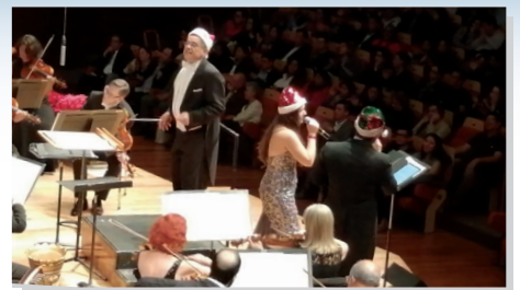
Concierto Navideño para egresados y sus familias en la Sala Nezahualcóyotl