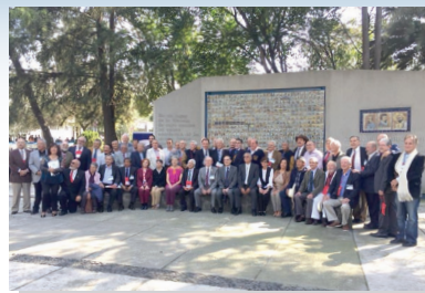
45 años de la Generación 70-74 de Veterinarios